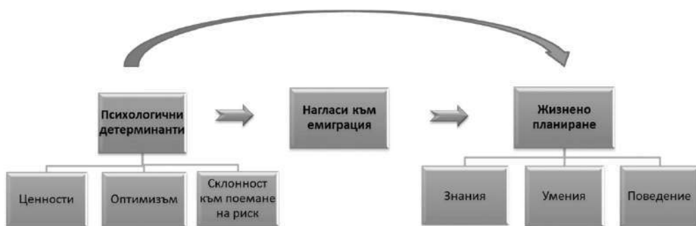
Фигура 4. Изследователски модел „Взаимовръзка между психологични детерминанти, нагласи към емиграция и жизнено планиране при младите хора в България“

В същото време в по-общ план тенденциите в развитието на календарните методи са обещаващи, тъй като в последните години приложението им в социалните изследвания отбелязва растеж , особено в проучвания с големи извадки и в лонгитюдни изследвания (по Glasner, 2009; Glasner, 2012). Погледите са отправени към областта на когнитивните науки и сродните им полета (Tourangeau, 2000) с надеждата, че могат да бъдат използвани в бъдеще