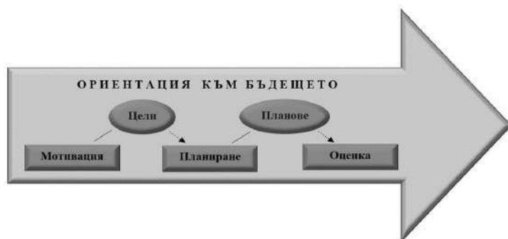
ФИГУРА 1. ОРИЕНТАЦИЯ КЪМ БЪДЕЩЕТО, ПРЕЗ ПРИЗМАТА НА ТРИ ПРОЦЕСА